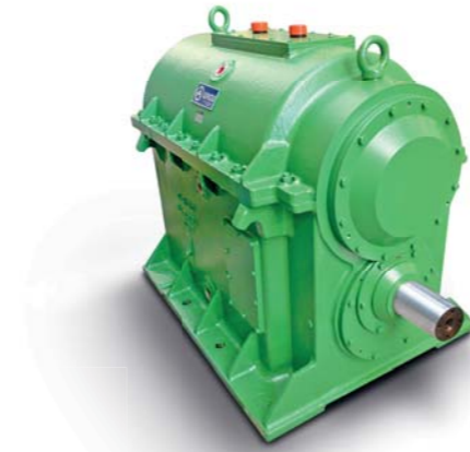
Getriebe für Kohlemühlen

Kessel und Ascheabzug — Stirnradgetriebe für Gebläse- Kohlemühlen Stirnradgetriebe von Typ ZTE für Kugelmühlen zur Nassmahlung von Kalkstein Getriebe für Schlackenbrecher