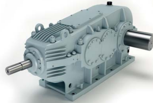
Kegelstirnradgetriebe für Bandanlagenantrieb

Materialbe- förderung — Kegelstirnradgetriebe für Bandanlagenantrieb