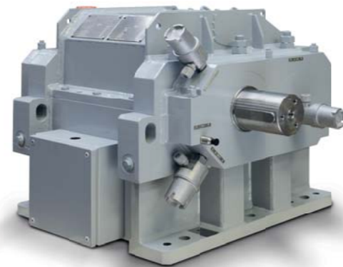
Schnelllaufgetriebe RSB 250

Maschinen- raumanlagen — Schnelllaufgetriebe für Leistungen bis zu 60 MW für Gas- und Dampfturbinen Generatorantriebe Turboladerantriebe Turbokompressor-Antriebe Antriebe für Speise- und Umlaufpumpen Leitschaufeln