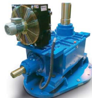
SK400-Typ Getriebe für Kühltürme

Sonstige Antriebe — Hilfsgetriebe Krangetriebe