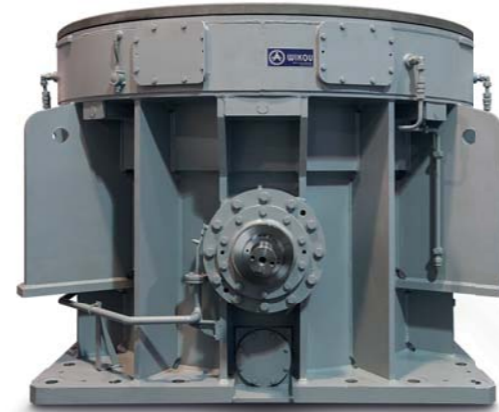
VMH Getriebe für Vertikalbrecher

Kessel und Ascheabzug — Stirnradgetriebe für Gebläse- Kohlemühlen Stirnradgetriebe von Typ ZTE für Kugelmühlen zur Nassmahlung von Kalkstein Getriebe für Schlackenbrecher