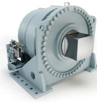
Engranaje planetario coaxial con eje cuadrado para accionamiento del molino