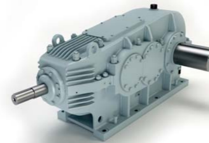
Engranaje cónico helicoidal para accionamiento de la cinta transportadora