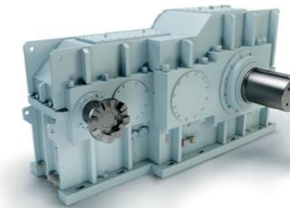
Engranaje de eje paralelo para los secadores de tambor