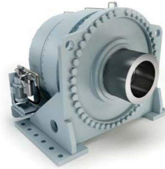
Engranaje planetario coaxial con eje hueco