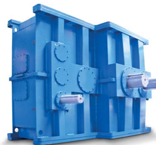
Симметричный цилиндрический редуктор для смесителя 320 л