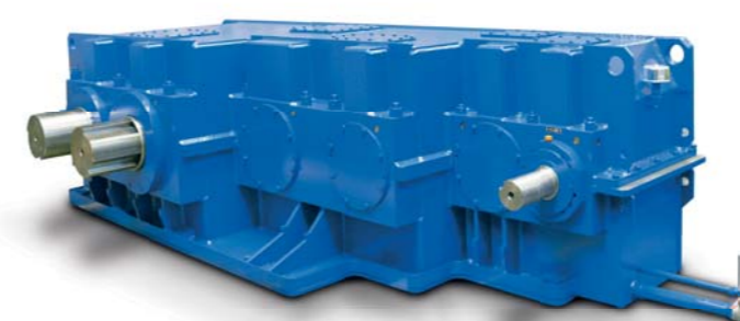
Редуктор смесителя для замены имеющихся редукторов