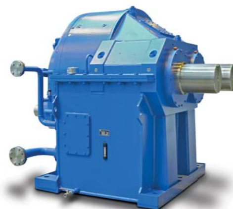
Инновационный цилиндрическо-планетарный редуктор смесителя