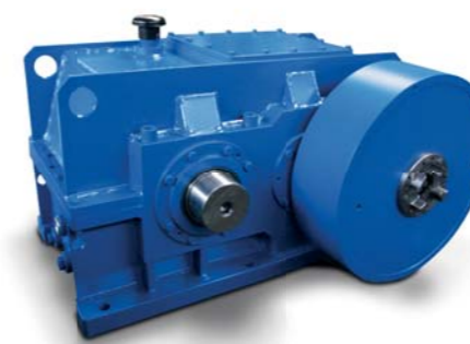
Цилиндрический редуктор ножниц