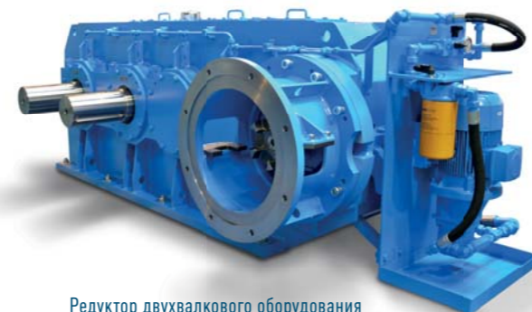
Редуктор двухвалкового оборудования

Новый улучшенный дизайн без отдельного агрегата смазки