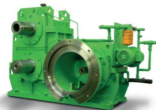
Редуктор двухвалкового каландра