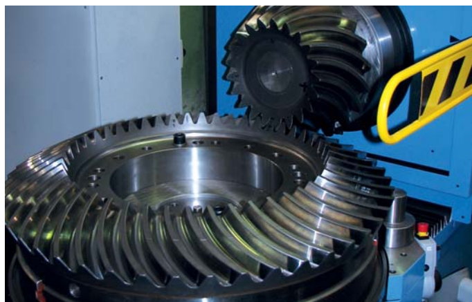
Měřicí přístroj IMO 1000